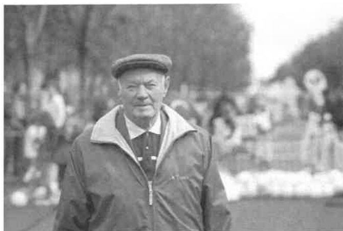
Buzánszky Jenő (1925-2015)