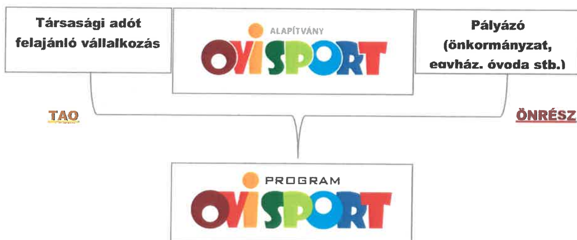
Az Ovi-Sport Program felépülése

Az Alapítvány pályázatok kiírása útján szeretné az óvodákat támogatásban részesíteni az alábbi módon: a sportpálya, valamint a képzések és képzési eszközök költségének egy részét a pályázónak kell finanszíroznia, a teljes bekerülési költség másik részét az Alapítvány biztosítja a támogatókon keresztül. Ezen elképzelést nagyban támogatja a TAO törvény , melynek köszönhetően a társasági adót fizető cégeknek lehetőségük van arra, hogy adójuk átirányításával a sportfejlesztések és a hozzá kapcsolódó utánpótlás-nevelés akár helyi szinten, a legkisebb korosztályt támogatva valósuljon meg.