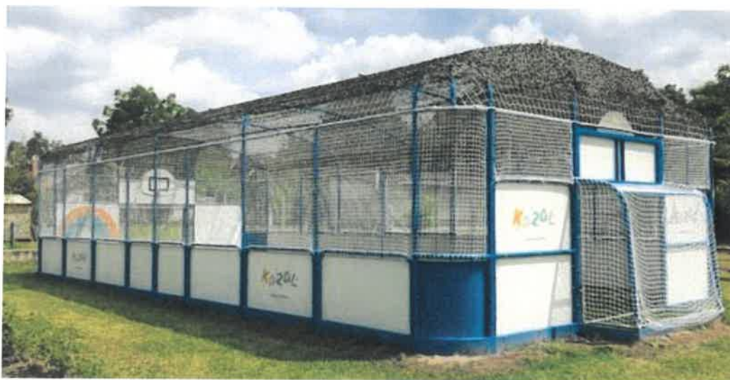
Az idei programunkban szereplő, legújabb Ovi-Sport Pálya

Az Ovi-Sport Pályák palánkkal körülkerítve, hálóval lefedve készülnek. Mérete: 6 x 12 méter, amely a nagyobb sportpályák arányainak felel meg. Komplex jellege alkalmassá teszi a következő sportágak művelésére, illetve alapjainak elsajátítására: röplabda, kézilabda, labdarúgás, kosárlabda, tenisz és tollas . Ezekon kívül alkalmas eséstan oktatásra , valamint ügyességi játékok, mozgáskoordinációs feladatok gyakorlására egyaránt.